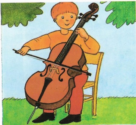
Violončelista pri hre sedí a nástroj drží medzi kolenami.

Tieto obry v skupine sláčikových nástrojov majú veľmi hlboký tón. Pri hre ich hudobník drží na zemi opreté o bodec.