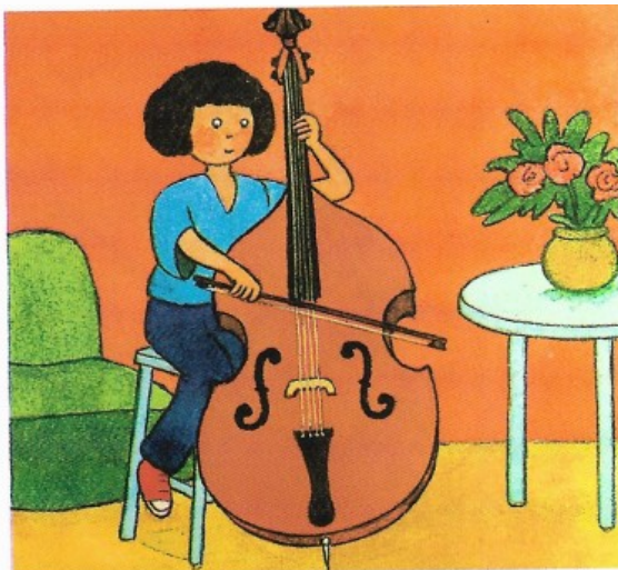
Na kontrabase sa hrá buď postojacky, alebo v sede na vysokej stoličke.